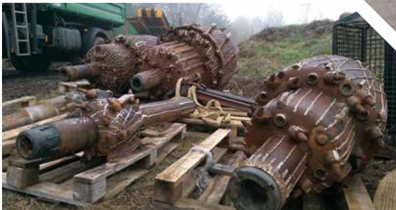
Die für die Bohrung eingesetzten Räumler

Ende März war es soweit – nach umfangreichen Vorbereitungen wurde der neue Trinkwasserleitungsdüker in das Bohrloch eingezogen. Damit war ein Großteil der Baumaßnahme zur Erneuerung des ca. 550 m langen Abschnitts der Hauptversorgungsleitung, die vom Wasserwerk Mahlenzien zum Hochbehälter Marienberg verläuft, vollbracht.