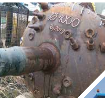
Schweres Gerät bei der BRAWAG

QUELENNACHWEISE: Titelmotiv: StWB; Inhaltsverzeichnis: StWB; Inhalt: Stadt Brandenburg an der Havel: muellerkrieg architekten; StWB: StWB; Bäckerei Röhe; Berkut_34@iStock.com; DRK Rettungshundestaffel; Daniel Dosdall, BLDAM; Klinikum: Klinikum Brandenburg; VBBR: VBBR; BDL: BDL, Regattastrecke Brandenburg; Mebra: muelltrennung-wirkt.de; Brawag: Brawag; Theater: Brandenburger Theater; Anna Loos © Kristian Schuller; Dschungelbuch@Thomas Bueening; shutterstock©Olga Otchenkow; wobra (c) Märkplan; Rückseite: Blick auf den kleinen Beetzsee von Christian Barkowsky – christian@plenta.io. Vielen Dank!