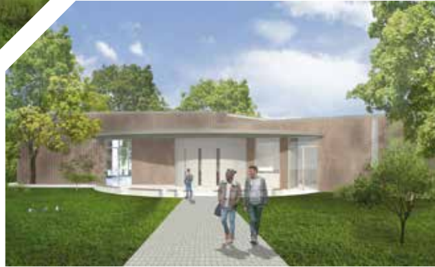
Modell des Eingangs zur neuen Mensa des Brecht-Gymnasiums