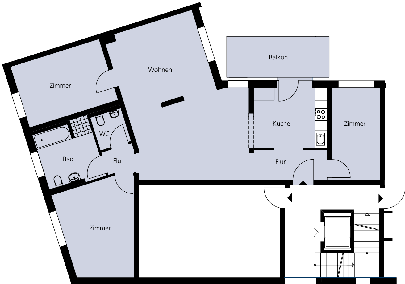
Abb. Grundriss: eine der drei uneingeschränkt mit dem Rollstuhl nutzbaren Wohnungen im 1. Obergeschoss mit rund 115 m 2

Die Fertigstellung und der Erstbezug sind zum April 2022 geplant. Bei Mietinteresse und für weitere Informationen wenden Sie sich bitte per Mail an: kundencenter@wobra.de