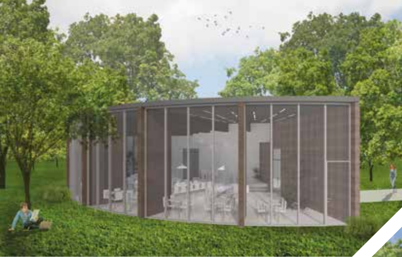
Blick in die neue Mensa aus westlicher Richtung (muellerkrieg architekten part mbb)